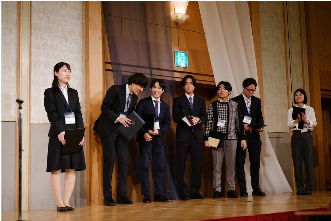
2023年10月19日 学生優秀賞表彰式 （大木氏は都合により御欠席）