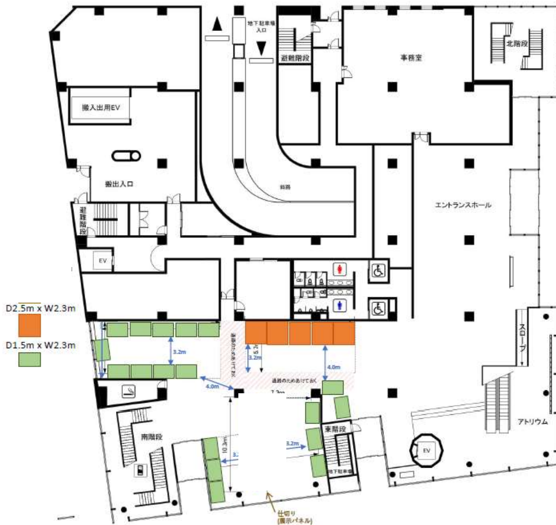
1F 交流ギャラリー配置案