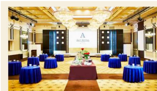
宴会場 舞 モダンなデザインの大ホール。迫力あるシャンデリアと開閉式天井が特徴。 ●面積:500㎡ ●最大収容人数 立食:230名 / 正餐:180名