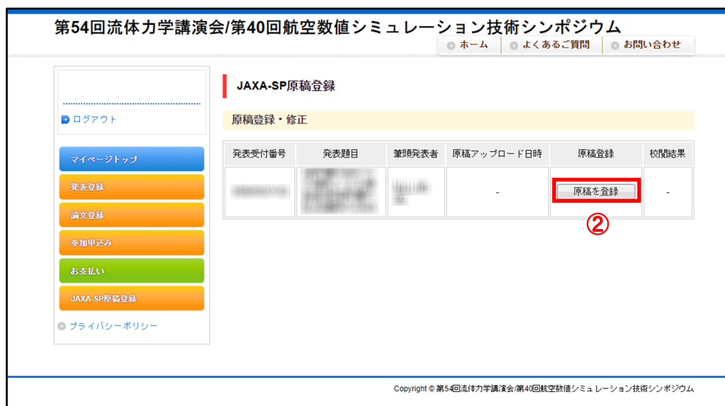
JAXA-SP 原稿登録画面（初回投稿時）

クリックし、JAXA-SP 原稿登録画面へアクセスします。原稿登録画面の②「原稿を登録」から1.で作成した ZIP をアップロードします。ファイルサイズは10MBまでとなっておりますが、その制限を超えてしまう場合は ryu-anss-sp(a)chofu.jaxa.jp まで問い合わせください (“a”)をアットマークに変更してください)。「JAXA-SP 論文登録受付」メールが学会サイトから自動送信され、原稿の投稿は完了です。原稿に不具合などが無ければ3.以降の作業は不要です。