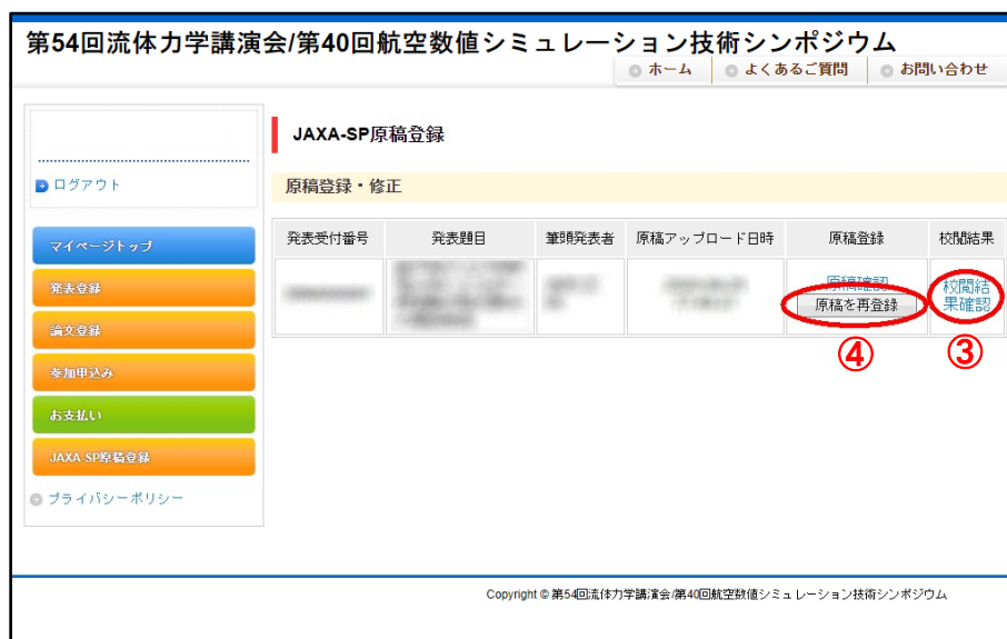
JAXA-SP 原稿登録画面（再投稿時）